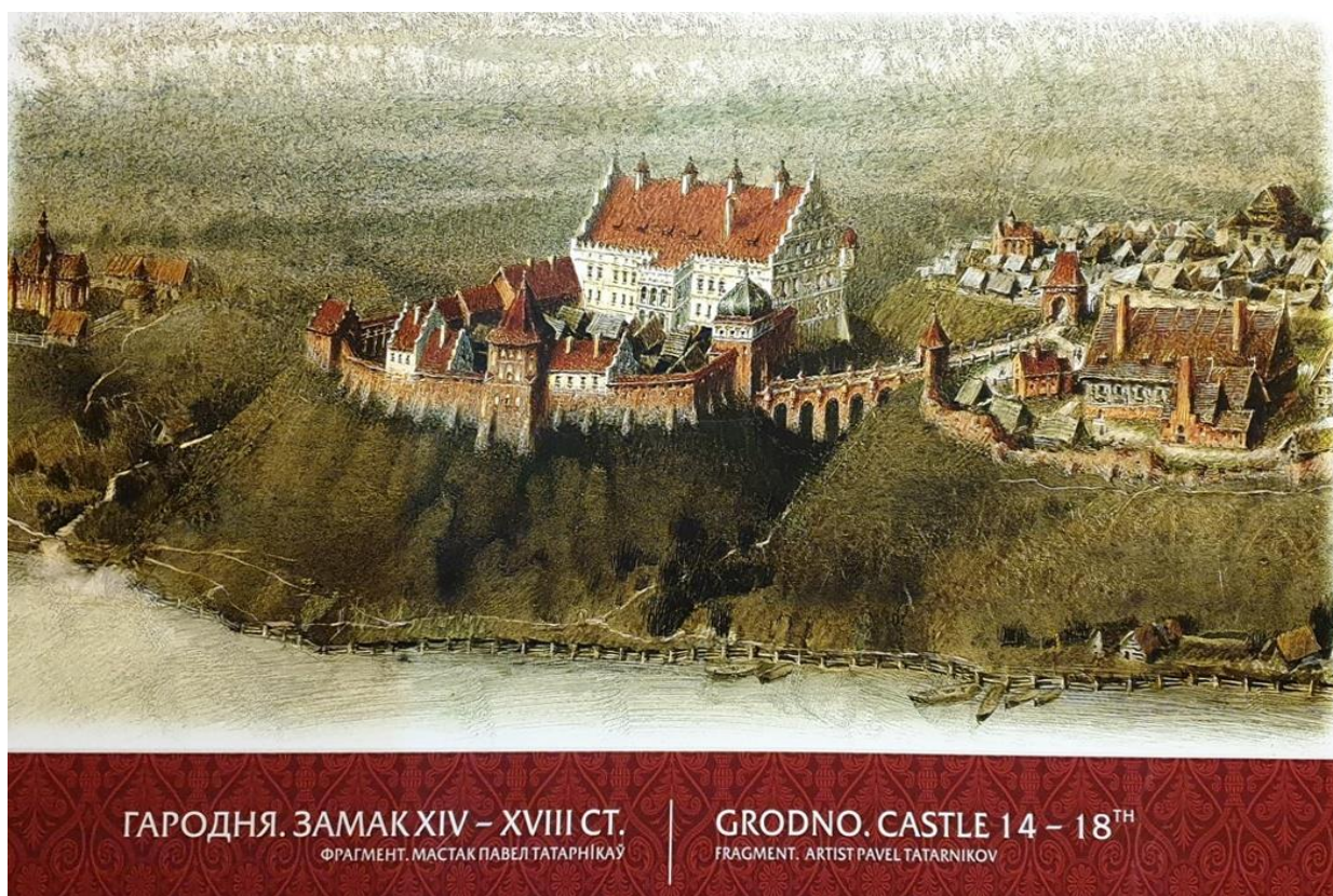
Слайд 6. Гродно. Замок 14-18 ст.