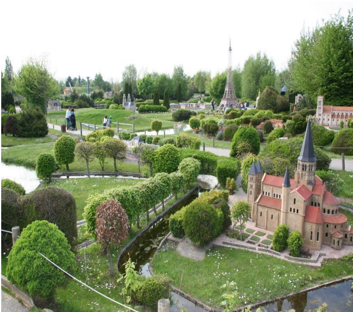
Слайд 3. Музей-парк под открытым небом «Франция в миниатюре».

Примером может служить комплекс «Франция в миниатюре»: https://best-tour.fr/na-avtomobile/4