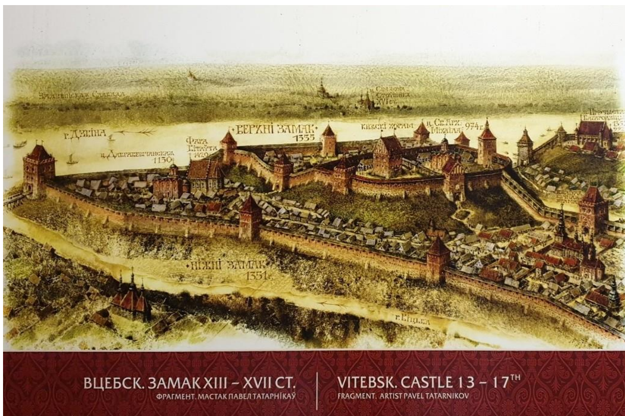
Слайд 5. Витебск. Замок 13-17 ст.